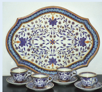
Tiroler Kunstkataster - Kulturgüterdokumentation des Landes