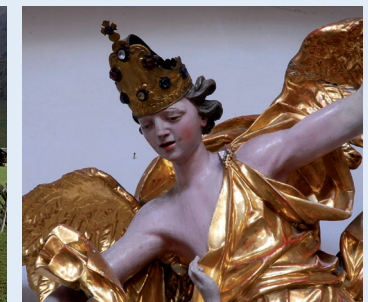
Tiroler Kunstkataster - Kulturgüterdokumentation des Landes