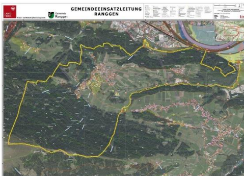
Beispiel: Karte für GEL mit Orthofoto